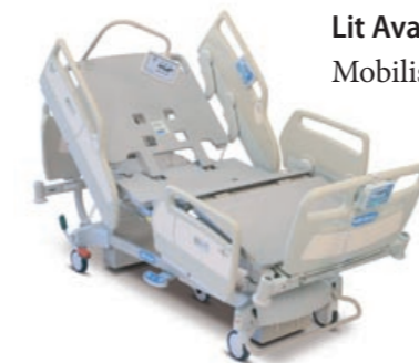
Lit AvantGuard® 1600 Mobility Mobilisation Patient

Parce que chaque établissement est différent, Hill-Rom propose deux modèles de lits pour répondre à tous vos besoins :