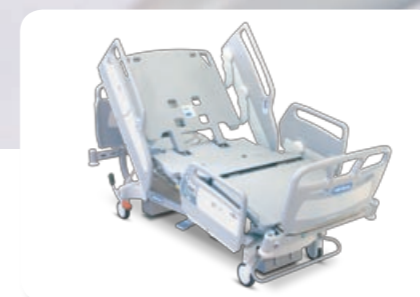
Lits AvantGuard® 1600

France .....+33 (0)2 97 50 92 12 United Kingdom .....+44 (0)1530 411000 Deutschland .....+49 (0)211/16450-0 Nederland .....+31 (0)347 32 35 32 Italia .....+39 02-950541 Suisse/Schweiz .....+41 (0)21/706 21 30 (deutschsprachig) .....021/706 21 38 Österreich .....+43 (0)2243 / 28550 Ireland .....+353 (0)1 413 6005 España .....+34 (0)93 6856000 Portugal .....+351 210 991 891 Nordic Countries .....+46 (0)8 564 353 60