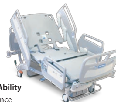
Lit AvantGuard® 1600 Ability Ergonomie et performance